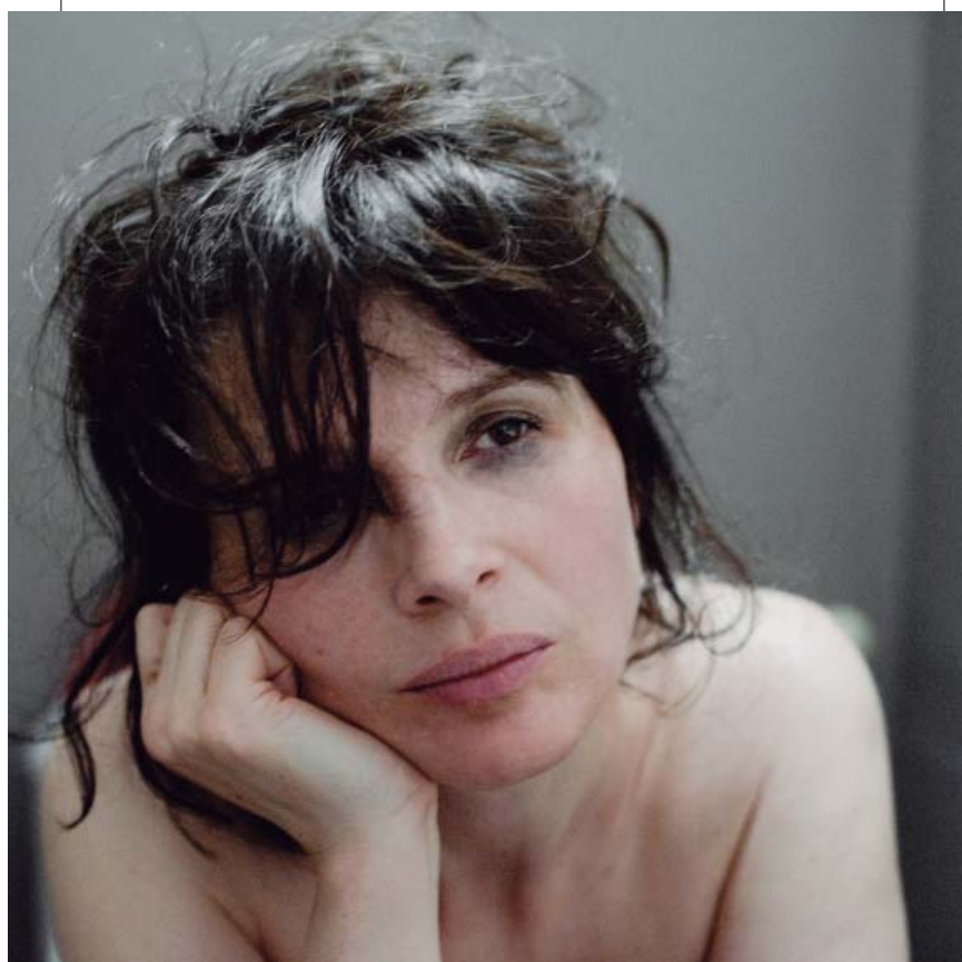
Juliette Binoche en el film "Ellas"

Todas las entidades que atienden a víctimas vienen denunciando estos efectos perversos y también que el protocolo es un mecanismo insuficiente. Las personas que hemos trabajado en prostíbulos y que conocemos los discursos de las mujeres en el contexto del día a día también sabemos que utilizando sólo un protocolo de preguntas es muy difícil conocer la situación real de esa persona, ya que el estigma que ella misma interioriza hace que muchas